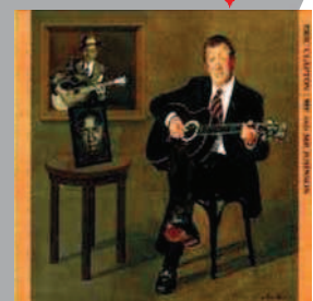
Me And Mr. Johnson