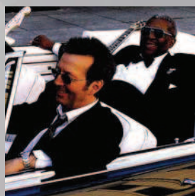
Riding With The King